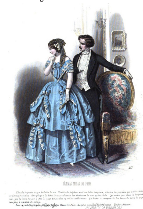
Figura 3. Modas de París