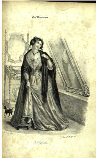
Figura 2. La Coqueta

Fuente: Adaptado de Los mexicanos pintados por sí mismos (p. 137), por Hesiquio Iriarte, 1854-1855, Imprenta de Murguía.